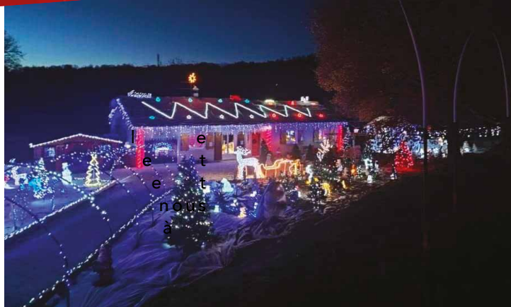
La maison de la famille Laborde devenu un vrai lieu de pèlerinage pour les amoureux de Noël !