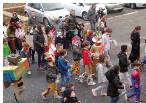
Le Carnaval des enfants de l'école