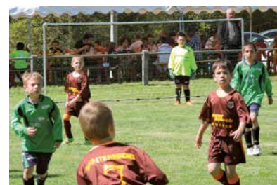
Les incontournables tournois de foot de jeunes de l'Ascension