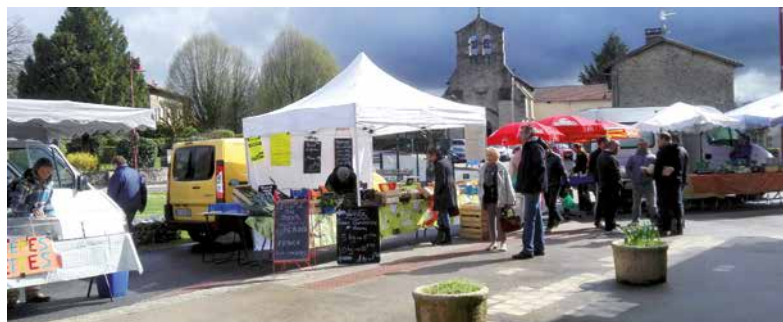
Le Marché gourmand de Bonnac