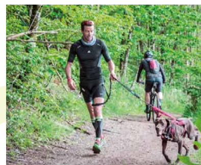
1 er Canitrail national le 14 mai