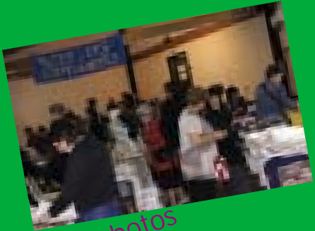
Album photos souvenir