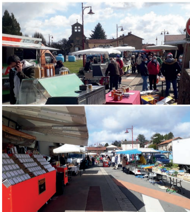
Le marché de Bonnac-la-Côte, un succès tous les samedis !