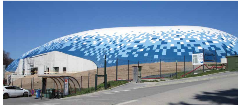
Couverture du vélodrome le 22 mars.