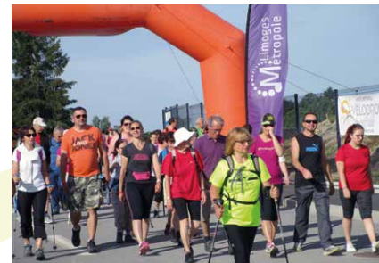
Bonnac, capitale de la Marche nordique les 1 er et 2 juin.