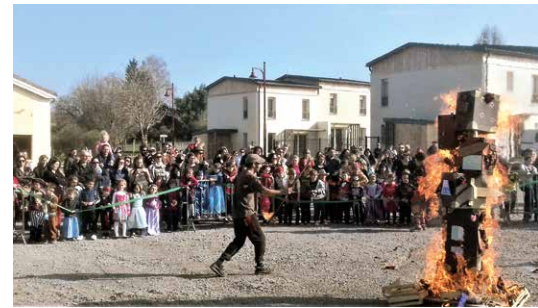
Le Carnaval des enfants de l'école.