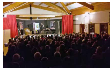
La soirée théâtre de Bonnac Loisirs a fait le plein.